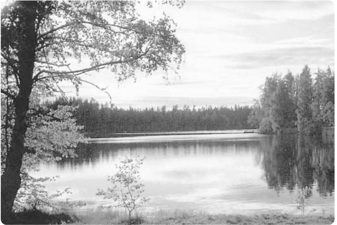
S:a Mosaren, Väse socken.